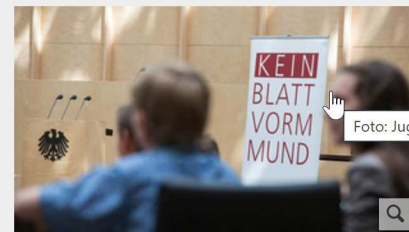
Foto: Jugendliche beim Schülerzeitungswettbewerb im

Bundesratspräsident Peter Tschentscher zeichnet am 28. Juni 2023 die besten Schülerzeitungen Deutschlands aus. Die Preisverleihung des Schülerzeitungswettbewerbs der Länder "Kein Blatt vorm Mund" findet im Bundesratsgebäude statt.