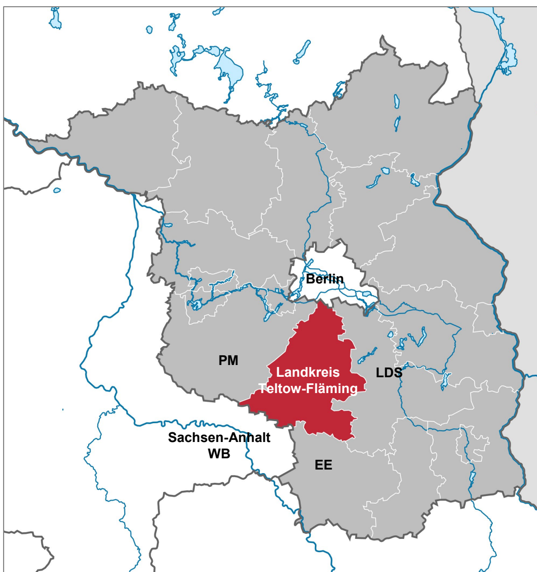
Abbildung 1: Landkreis Teltow-Fläming Copyright 2020 Free Software Foundation, Inc.