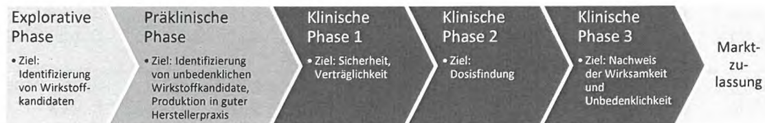
Abbildung 1: Übersicht über Phasen der Impfstoff-Entwicklung

Nach Herstellung eines möglichen Impfstoffkandidaten im Forschungslabor wird in ersten Tier- und Zellkulturexperimenten überprüft, ob dieser neben der Verträglichkeit geeignet ist, eine Schutzwirkung gegenüber dem Zielerreger bzw. der von diesem ausgelösten Infektionskrankheit, sofern hierzu ein Tiermodell existiert, hervorzurufen. Anschließend werden toxikologische und pharmakologische Eigenschaften in verschiedenen Tiermodellen überprüft. Erst wenn es keine Bedenken hinsichtlich der Anwendung beim Menschen gibt, wird in einer ersten klinischen Prüfung die Unbedenklichkeit an Freiwilligen, gesunden Erwachsenen untersucht (Phase 1). In den nachfolgenden klinischen Studienphasen wird die optimale Dosierung und das Impfschema in einer größeren Anzahl von Freiwilligen (mehrere hundert) überprüft (Phase 2) und anschließend in einer großen randomisierten kontrollierten klinischen Studie (Phase 3) mit mehreren tausenden Freiwilligen verschiedener Altersgruppen die Wirksamkeit und das Nebenwirkungsprofil des Impfstoffs ermittelt.