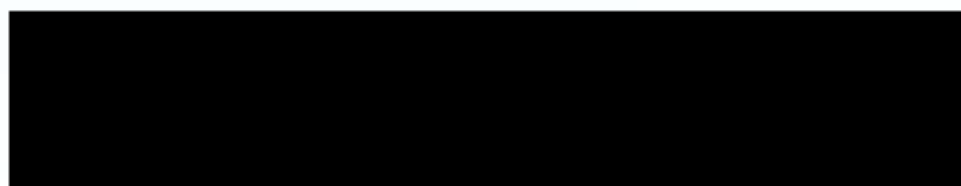
Christoph Reifferscheid Präsident des Bildungszentrums der Bundeswehr