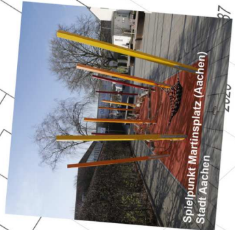
Spielplatz Martinsplatz (Aachen) Stadt Aachen