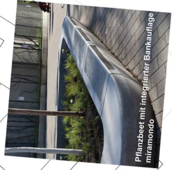
Pflanzbeet mit integrierter Bankauflage miramondo