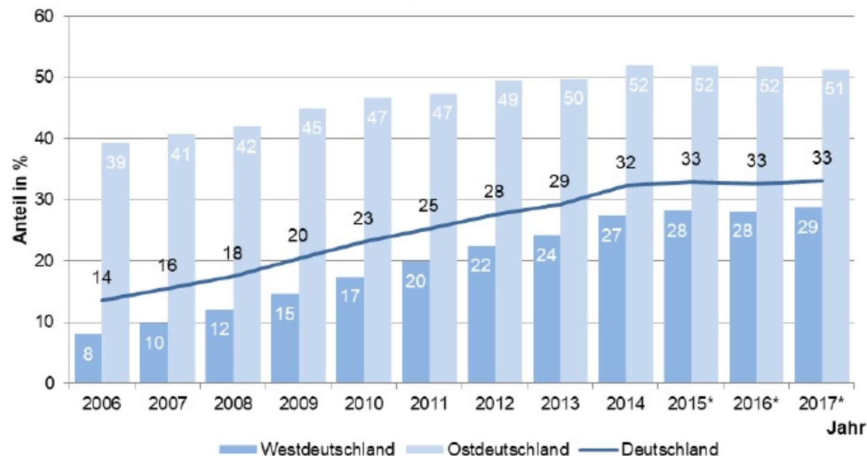
Abb. 1: Inanspruchnahmequote von Kindertageseinrichtungen und Kindertagespflege* durch Kinder im Alter von unter 3 Jahren 2006 bis 2017 nach Region

Lesebeispiel: 33 % aller Kinder unter 3 Jahren in Deutschland besuchten im Jahr 2017 ein frühkindliches Bildungsangebot.