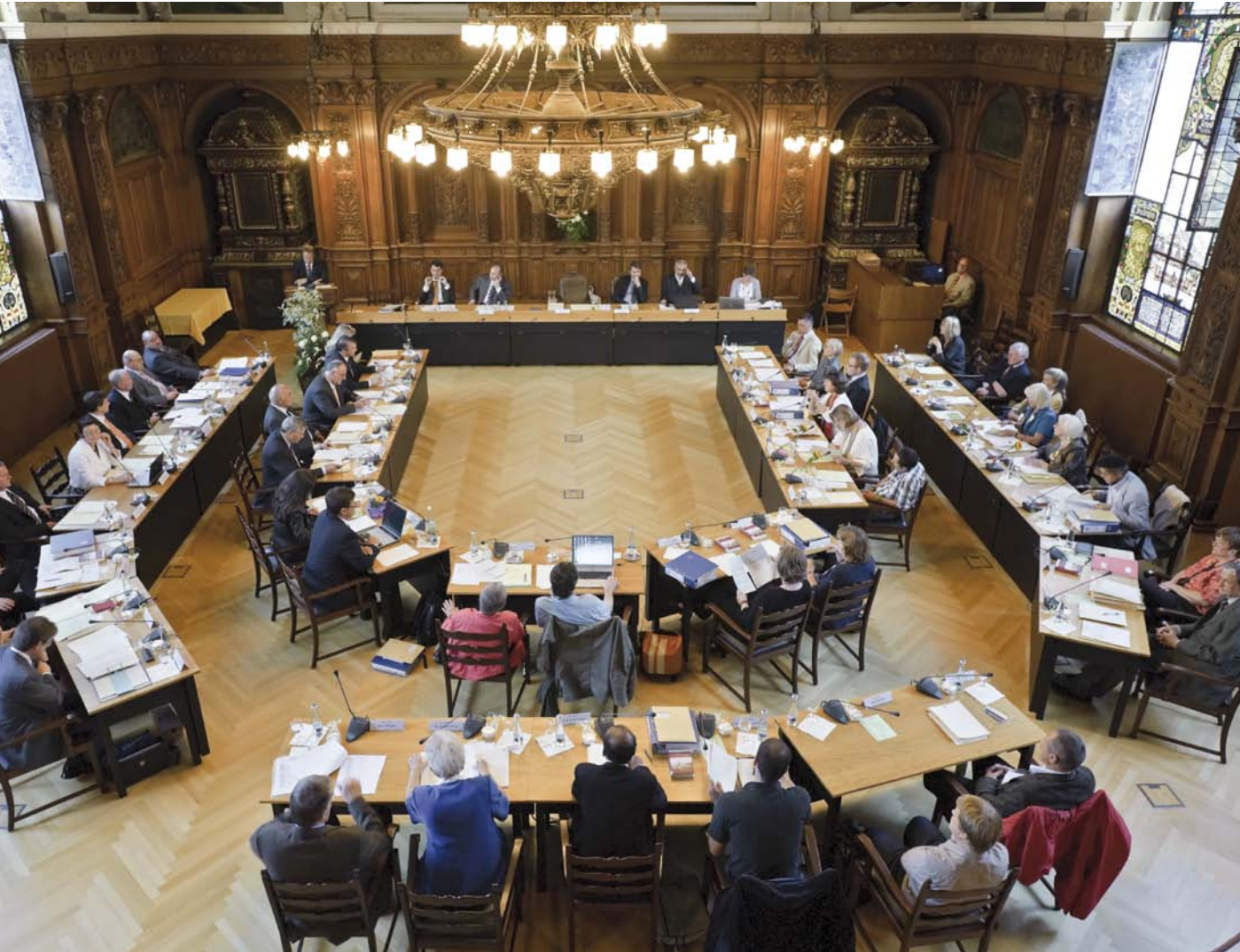
Sitzung des Heidelberger Gemeinderates