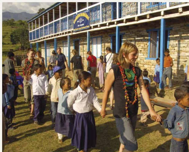
Schüler aus Gati und Freiberg gemeinsam vor der Schule