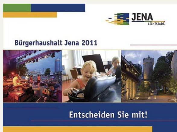
Titelblatt zum Bürgerhaushalt Jena 2011