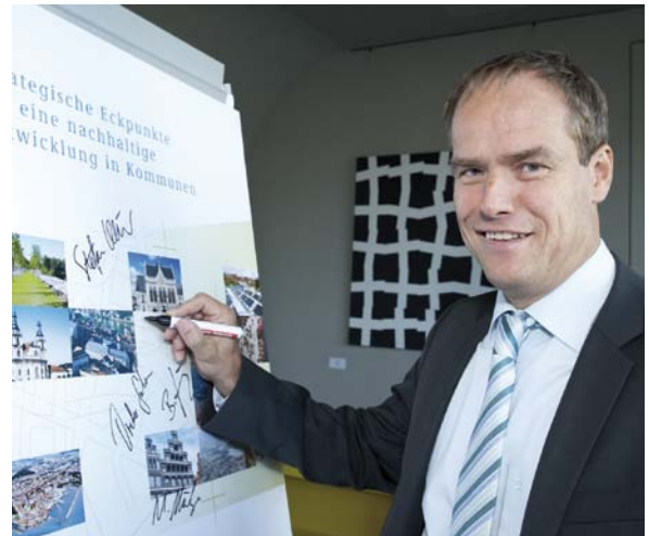
Der Oberbürgermeister von Heidelberg unterzeichnet beim Rat für nachhaltige Entwicklung die strategischen Eckpunkte für eine nachhaltige Entwicklung in Kommunen

Unter dem Titel „Viel geschafft, mehr tun“ verweisen die Kommunen und lokale Akteure in der „Rio+20“-Erklärung auf den Grundsatz, dass eine nachhaltige Entwicklung insbesondere vor Ort erfolgen muss und die tiefgreifenden Veränderungen auch messbar sein sollten. Der notwendige sozial-ökologische Umbau von Wirtschaft und Gesellschaft könne nur in gemeinsamer Anstrengung von Politik, Verwal-