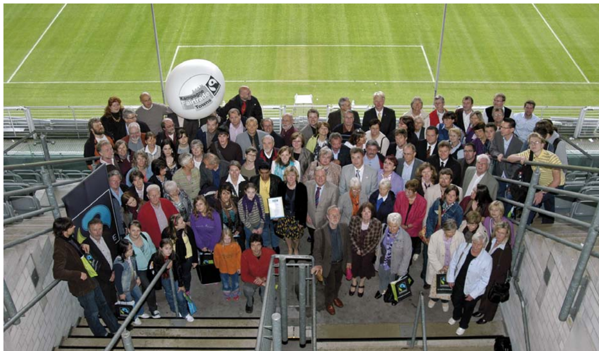
Preisverleihung Fairtrade Stadt Dortmund 2009 im Signal Iduna Park

Kommunen können gerade im Bereich der öffentlichen Beschaffung ein Vorbild für Verbraucherinnen und Verbraucher sein, so zum Beispiel, wenn sie Ökostrom beziehen, ihre Gebäude ökologisch sanieren, energiesparende Bürogeräte anschaffen und ihre Kantinen mit regionalen, ökologischen und fairen Produkten versorgen.