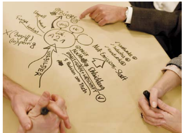
World-Café im Rahmen des 5. Netzwerk21 Kongresses in Hannover 2011

Auch in Deutschland sind Kommunen von einigen dieser zumeist komplexen Probleme betroffen und die Menschen sowie die Entscheidungsträger vor Ort erfahren immer häufiger, dass eine Lösung mit herkömmlichen Strategien und Ressourcen kaum möglich ist. Zugleich verfügen die lokalen Akteure aber über Erfahrungen und Potenziale, die sie aktiv nutzen können, um neue Wege zu gehen und diesen Herausforderungen zu begegnen. Die Erfahrungen aus der Praxis zeigen, dass in unzähligen Städten und Gemeinden die Menschen vor Ort Chancen aufgreifen, Nachhaltigkeitsaktivitäten und experimentelle Vorhaben anbahnen und damit auch wichtige Lernprozesse einleiten. Die Aktivierung des zivilgesellschaftlichen Engagements spielt dabei eine bedeutende Rolle, zum Beispiel bei der Lösung sozialer Probleme, bei Kultur und Bildung oder bei Ressourceneinsparung und der Nutzung erneuerbarer Energien.