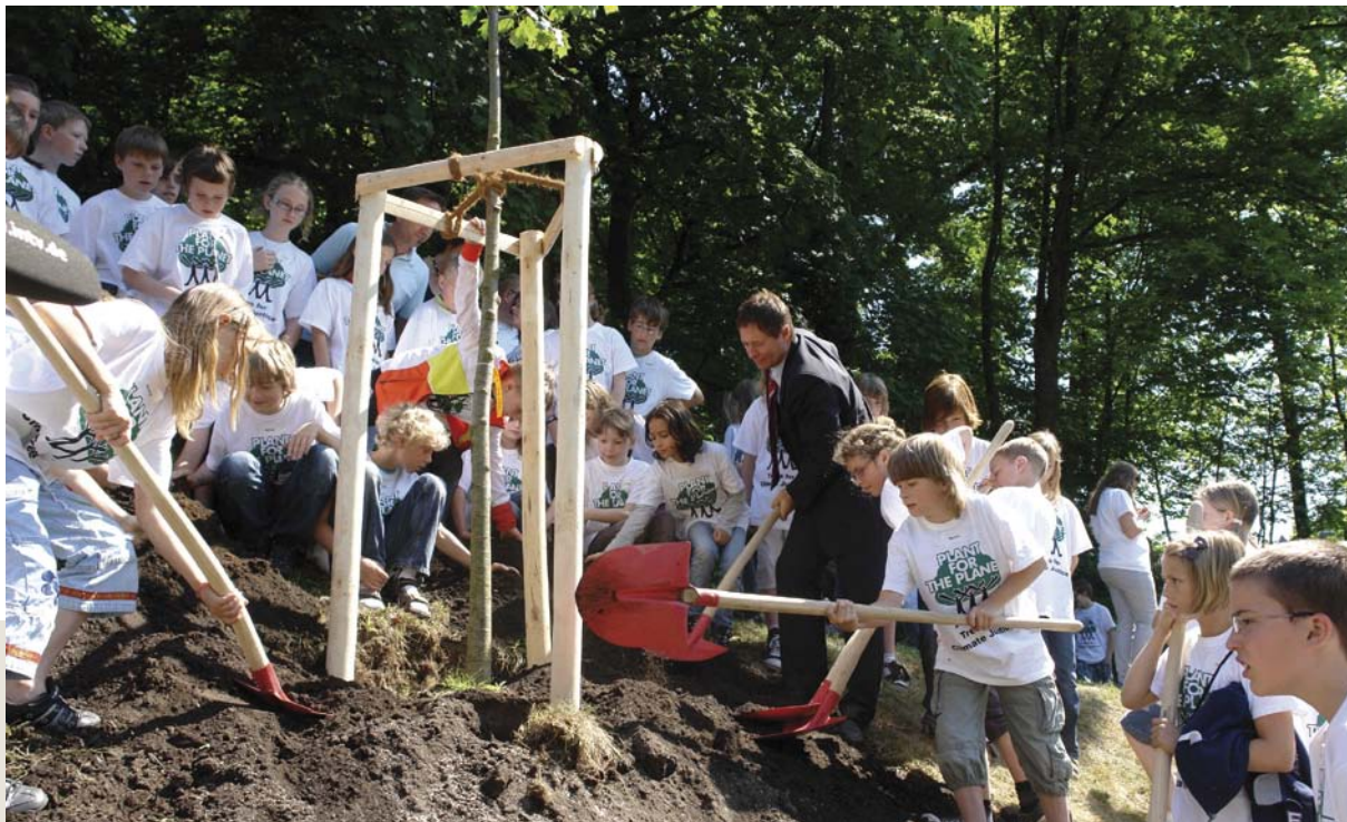
Im Rahmen einer „Plant-for-the-Planet Akademie“ in Neumarkt i.d.O. pflanzen 80 Kinder gemeinsam mit dem Oberbürgermeister Bäume im Stadtpark und setzen damit ein Zeichen für mehr Klimagerechtigkeit

Nachhaltigkeit kann ihre Wirkung nur entfalten, wenn sie durch die Menschen vor Ort gelebt wird. Kommunen schaffen dafür die notwendigen Experimentierräume. Dazu zählt auch, partizipative Prozesse zu unterstützen und den Akteuren Anerkennung und Auszeichnungen zuteilwerden lassen. Die