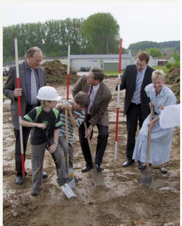
Spatenstich für den Bau des Multifunktionsplatzes