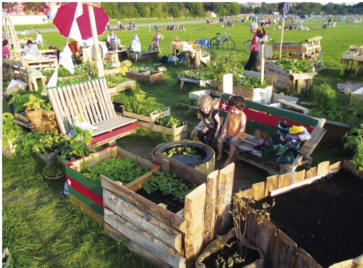
Gartengestaltung im Allmende-Kontor Berlin