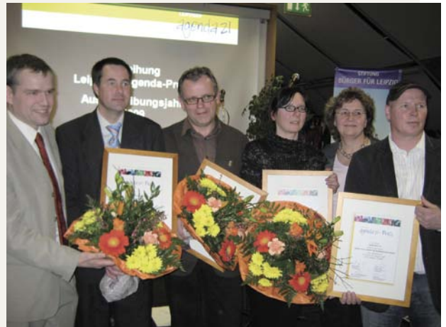
Verleihung des Leipziger Agenda-Preises 2009

Um das große Engagement vieler lokaler Akteure zu würdigen und auch langfristig zu erhalten, vergibt die Stadt seit 1999 jährlich einen Agenda-Preis in mehreren Kategorien. Der Preis wird in Kooperation mit den Stadtwerken Leipzig GmbH, der VNG – Verbundnetz GAS AG, der Sparkasse Leipzig und der Stiftung „Bürger für Leipzig“ vergeben. Neben der öffentlichen Anerkennung sind mit dem Preis auch finanzielle Mittel verbunden, die von zivilgesellschaftlichen Initiativen für die Umsetzung innovativer Projekte eingesetzt werden. Mit dem Agenda-Preis wird in Leipzig auch die Zusammenarbeit mit Migrantinnen und Mi-