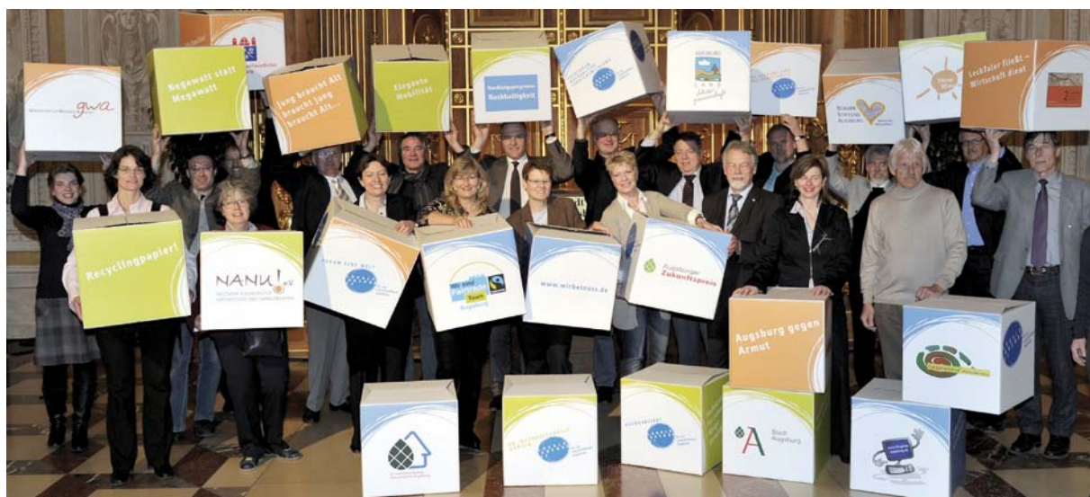
Agendabausteine der Stadt Augsburg

Eine Nachahmung ist möglich und lohnt sich – für die Menschen heute und in Zukunft. ■