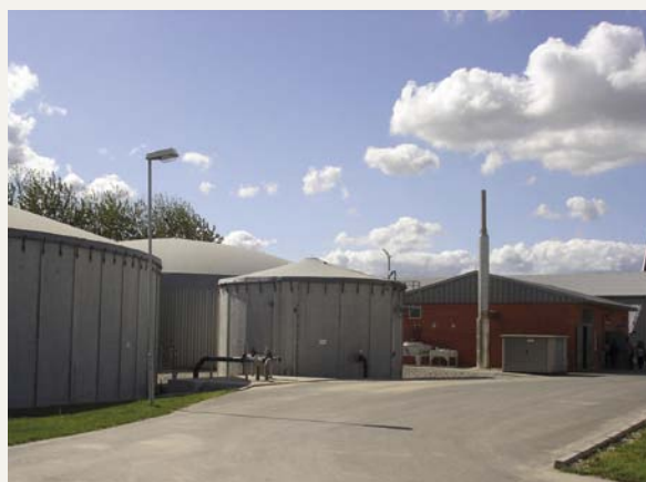
Biogasanlage in Feldheim