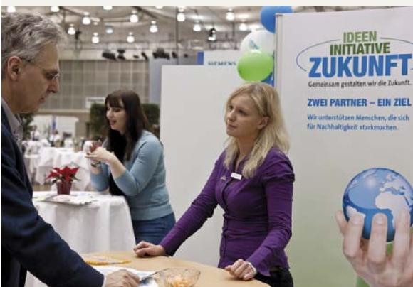
Die „Ideen Initiative Zukunft“ präsentiert sich auf dem 5. Netzwerk21 Kongress in Hannover

www.projekte.ideen-initiative-zukunft.de