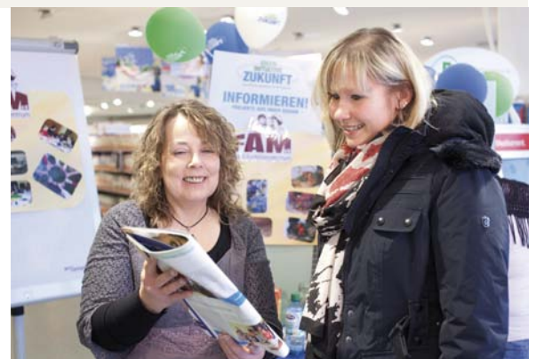
Vorstellung des Projekts „Offener Treffpunkt“ in einem dm-Markt in Bretten, Projektvertreter und dm-Kundin im Gespräch zur alverde-Sonderausgabe