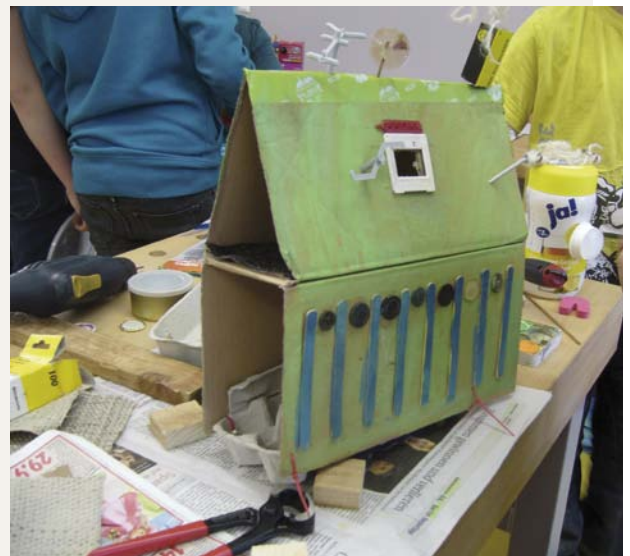
Grundschulkindern bauen im Workshop „Weg mit den Mogelpackungen“ ihr Modell einer zukünftigen Stadt

Ähnliche Synergie-Effekte zwischen Umwelt- und Sozialpolitik lassen sich durch Tauschbörsen erzielen. In vielen Städten sind beispielsweise Sozialkaufhäuser entstanden, die gebrauchte und gut erhaltene Güter sammeln und unentgeltlich an sozial bedürftige Personen abgeben oder