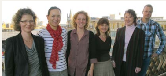
Projektteam „Zukunft einkaufen“ am Institut für Kirche und Gesellschaft der Evangelischen Kirche von Westfalen

Die Einführung eines nachhaltigen Beschaffungswesens erfolgt mit Unterstützung des