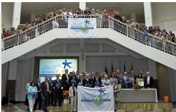
Unterzeichnung der „Magna Charta Ruhr.2010“ gegen ausbeuterische Kinderarbeit am 12.06.2010 im Rathaus Dortmund

Nachhaltige Beschaffung und fairer Handel hängen eng zusammen. Mit Hilfe von kommunalen Beschlüssen und einer daran anknüpfenden Öffentlichkeitsarbeit lassen sich beide Themen gut verbinden. So können Städte und Gemeinden glaubwürdig auch für ein verändertes Verbraucherverhalten im privaten Bereich werben.