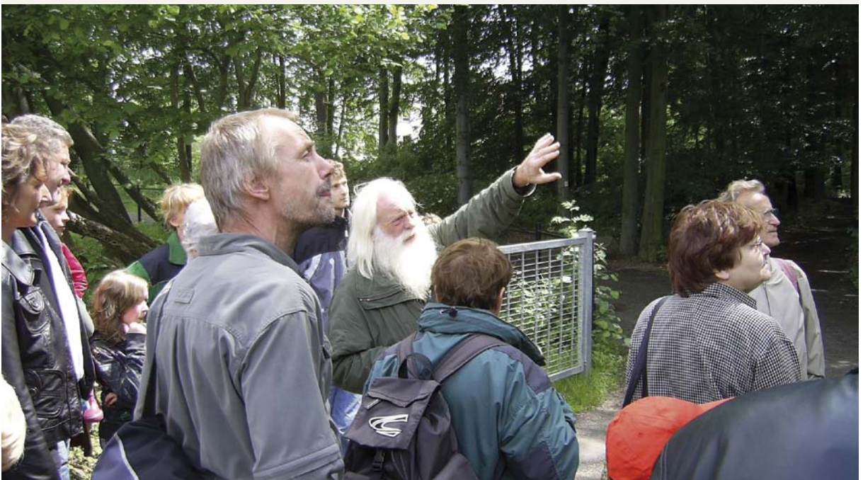
Referenzflächenbegehung im Crimmitschauer Wald mit einem Waldpädagogen

Mit der FSC-Zertifizierung des Stadtwaldes sind noch weitere positive Auswirkungen verbunden. So sind die Erkenntnisse, die mit diesem Vorhaben langfristig gewonnen werden, auch im Hinblick auf die Erforschung der Folgen des Klimawandels, den Erhalt der Biodiversität und für die kommunale Forstwirtschaft von großem Interesse. www.umweltzentrum-chemnitz.de