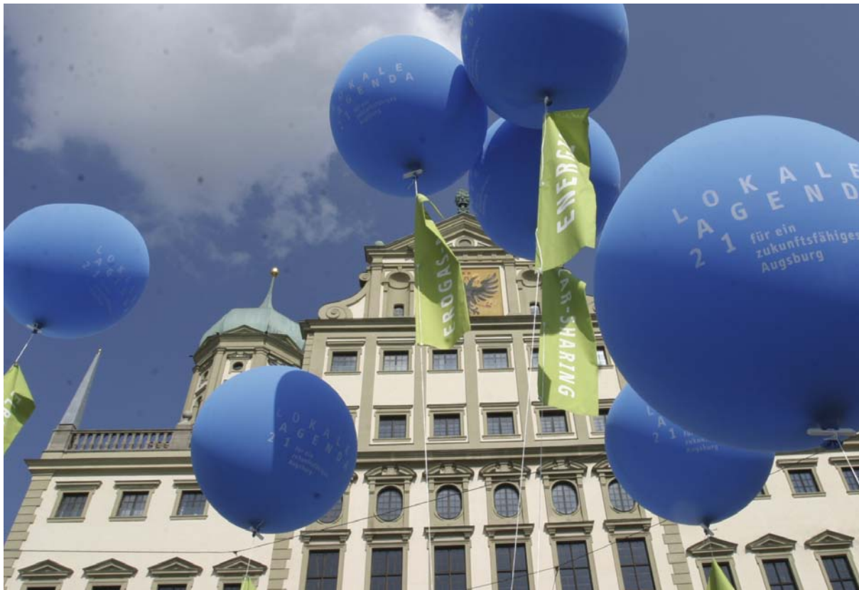
Agendaaktion auf dem Rathausplatz in Augsburg

Eine weitere Möglichkeit, Partizipation zur Weiterentwicklung und Umsetzung der Nachhaltigkeitsziele auch auf strategischer Ebene zu verankern, ist mit der Einführung einer Nachhaltigkeitsprüfung von Ratsvorlagen gegeben. Beflügelt wird dieses neue kommunalpolitische Instrument einer Nachhaltigkeitsprüfung durch den Trend, dass sowohl auf Ebene des Bundeslandes Baden-Württemberg als auch in der Bundesregierung und im Bundestag im Rahmen von Gesetzesfolgenabschätzungen Nachhaltigkeitsprüfungen durchgeführt werden und immer mehr Kommunen Interesse an diesem Konzept äußern. Aufgrund der Bedeutung von Monitoring und Evaluation für eine effektive Umsteuerung in Richtung Nachhaltigkeit wird dem Instrument Nachhaltigkeitsprüfung künftig eine noch größere Bedeutung zukommen. ■