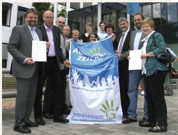
Verleihung der Klimaschutzflagge im Rahmen der Kampagne „Gemeinsam für Klimaschutz“ durch die LAG 21 NRW und die Lokale Klima-Allianz Kreis Unna an das Barlach-Gymnasium sowie an das Berufskolleg Werne

Preis geehrt. Gefördert wird der Kongress durch das Bundesumweltministerium, das Umweltbundesamt, die jeweils gastgebende Kommune sowie zahlreiche Sponsoren und ehrenamtliche Mitarbeiterinnen und Mitarbeiter. (vgl. www.netzwerk21kongress.de ).