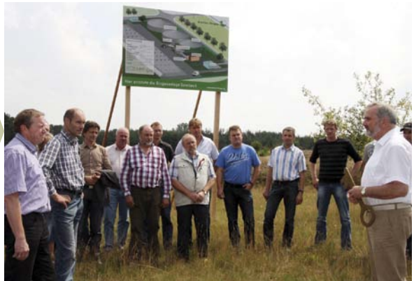
Schlüsselübergabe der Biogasanlagenfläche an die Landwirte in Saerbeck

Zu einer umfassenden und kohärenten Transformationsstrategie des Energiesystems gehört eine Vielzahl von Instrumenten und Konzepten, wie die energetische Sanierung des Altbaubestandes, die Förderung von energieeffizienten Neubauten bis hin zu Plusenergiehäusern, eine mittelfristige Umstellung der Stromerzeugung bzw. des Strombezuges auf erneuerbare Energien sowie Maßnahmen zur Bewusstseinsbildung und zur Änderung des Nutzerverhaltens.