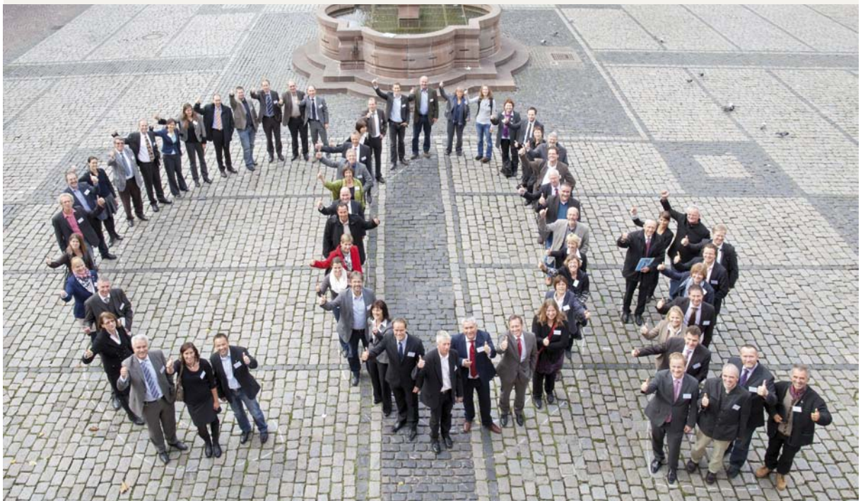
Konvent der Bürgermeister – Gründung des deutschen Clubs „Covenant of Mayors“ 2011 in Heidelberg