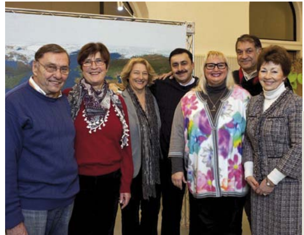
Integrationslotsen wurden in Hannover zu Umweltlotsen qualifiziert, Kooperationspartner ist das Agenda-21-Büro der niedersächsischen Landeshauptstadt