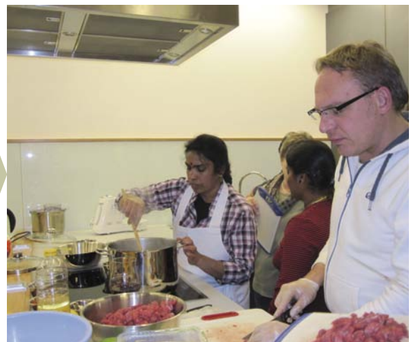
Kulturküche Aalen - TAMILISCHER KOCHTREFF

Interkulturelle Zusammenarbeit funktioniert dann besonders gut, wenn Menschen gemeinsam etwas aufbauen und gestalten können und über ihr gemeinsames Tun sowohl ihre eigene Kultur vermitteln als auch Verständnis für andere Kulturen entwickeln können. Niedrigschwellige Zugänge wie das gemeinsame Kochen und Gärtnern erleichtern den Einstieg und öffnen das Tor für weitergehende Aktivitäten.