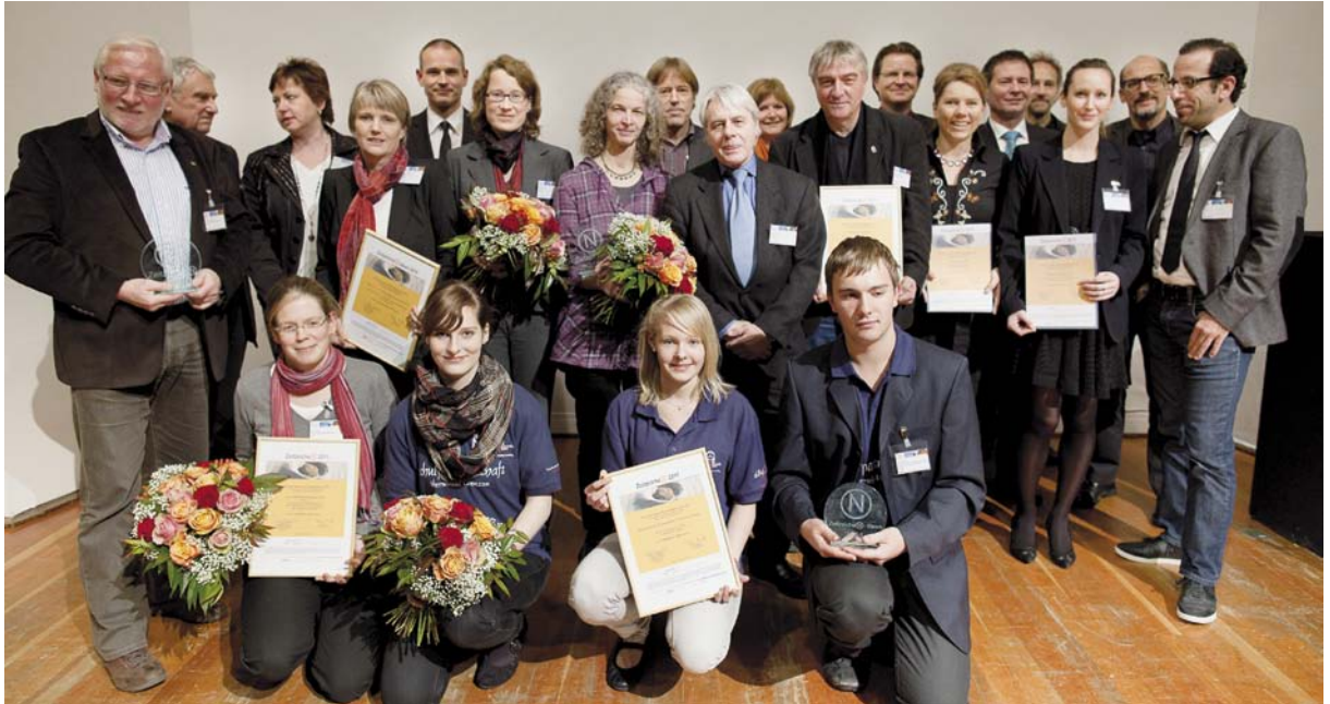
Preisträger des ZeitzeiChen-Preises 2011 auf dem 5. Netzwerk21Kongress in Hannover

Die Ausschreibung in mehreren Größenkategorien lädt gezielt auch mittlere und kleinere Kommunen ein, sich zu beteiligen und eine Würdigung für langjähriges Engagement zu erhalten.