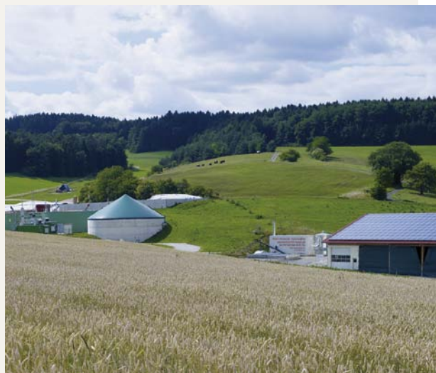
PV-Anlage und Biogasanlage mit Blockheizkraftwerk in Mauenheim, dem ersten Bioenergiedorf in Baden-Württemberg

In Städten und Gemeinden kann die Einrichtung von Windparks oder Biomassenanlagen – wie auch andere große Bauvorhaben – auf den Widerstand der Bevölkerung stoßen. Die frühzeitige Beteiligung der Bevölkerung bereits in der Planungsphase schafft erfahrungsgemäß ein konstruktives Klima der Auseinandersetzung und kann auch zur Lösung von Interessenskonflikten beitragen. Dafür gibt es eine Vielfalt an Verfahren. Ein Ergebnis gemeinsamer Planung kann beispielsweise ein eigenes Bürgerunternehmen oder auch ein „Bürgerwindrad“ sein, das aus Mitteln der Anwohner und lokalen Gewerbetreibenden finanziert wird und dessen Rendite in der Region verbleibt und an die lokalen Investoren zurückfließt. ■