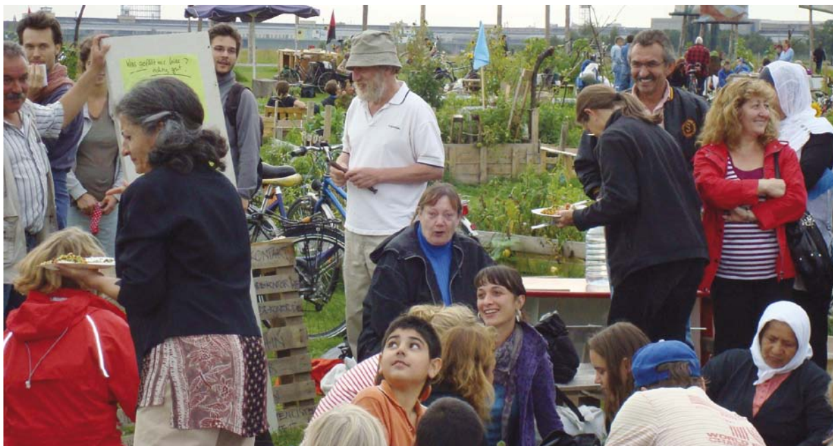
Picknick und Flächenplanung im „Allmende-Kontor“, einer Pionierfläche auf dem ehemaligen Flughafen Tempelhof