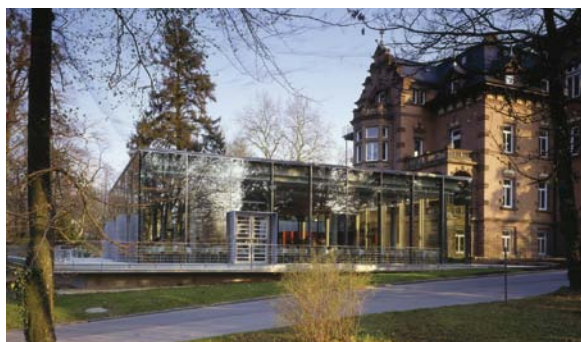
Das Restaurant der Evangelischen Akademie Bad Boll

Kirchliche Einrichtungen, die ihre Beschaffung nach ökologischen und sozialen Kriterien organisiert haben, führen oftmals auch ein integriertes Umweltmanagementsystem ein und erzielen damit zusätzliche positive Effekte: Sie entlasten die Umwelt und reduzieren die Kosten. Dadurch entwickeln sich manche kirchliche Institutionen zu wichtigen Treibern. So wirkt die Evangelische Akademie Bad Boll mit ihrem Engagement gezielt in die Region hinein, gewinnt Produzenten vor Ort für die Erzeugung ökologischer Lebensmittel und schafft somit stabile ökologische Wertschöpfungsketten.