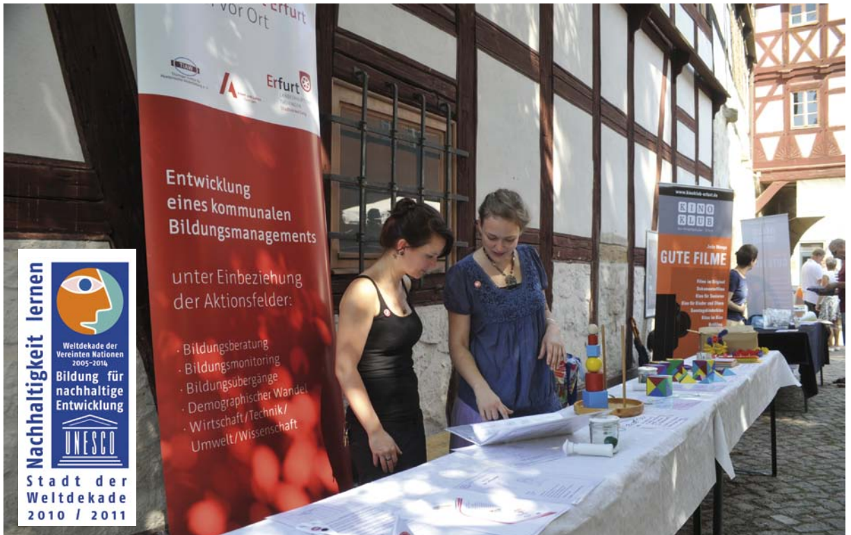
Bürgerfest Erfurt 2011: Die Stadt präsentiert sich als Bildungsstandort