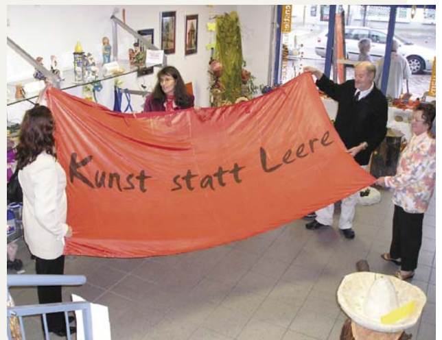
„Kunst statt Leere“ - Ausstellungseröffnung 2008