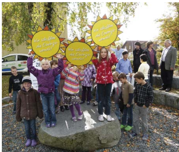
Schulprojekt zur Energiewende im Landkreis Fürstentfeldbruck – die Kinder sind aktiv dabei

In Deutschland hat der Wissenschaftliche Beirat für globale Umweltfragen (WBGU) deshalb einen neuen „Gesellschaftsvertrag für eine Große Transformation“ vorgeschlagen. Diese „Große Transformation“ wird vor allem in den Städten stattfinden und zu spüren sein. Dort sind Verbrauch und Emissionen auf der einen Seite besonders hoch, auf der anderen Seite gibt es dort aber auch unzählige Gestaltungs- und Veränderungspotenziale (vgl. WBGU „Welt im Wandel. Gesellschaftsvertrag für eine große Transformation“, Berlin 2011).