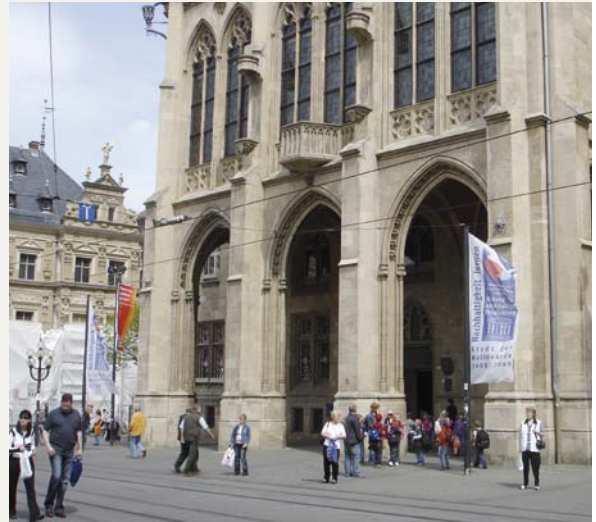
Erfurter Rathaus mit Fahnen „Bildung für nachhaltige Entwicklung“

Erfurt strebt an, sich in den nächsten Jahren zum innovativen Bildungsstandort und als Ort lebenslangen Lernens zu entwickeln. Verbindender Aspekt ist das Ziel, Bildungslandschaften zu etablieren. Ausgehend von einem Bildungsleitbild, in dem Bildung für nachhaltige Entwicklung