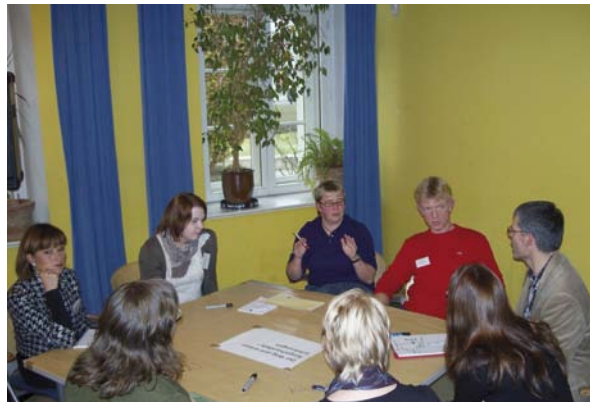
Veranstaltung „Kommunale Bürgerhaushalte - Erfahrungen und Perspektiven“ 2011 in Weimar

Generell sind bei der Durchführung eines Bürgerhaushalts nur die freiwilligen Leistungen einer Kommune beeinflussbar. Zur Abstimmung stehen