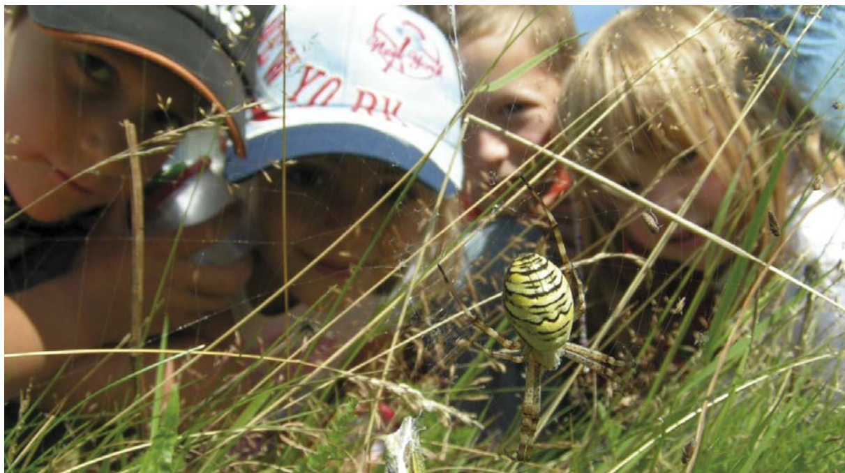
Kinder auf Entdeckungsreise in der Natur