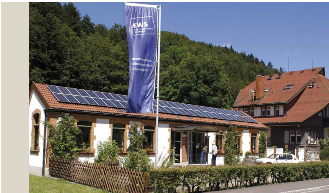
Firmenzentrale der Elektrizitätswerke Schönau (EWS)