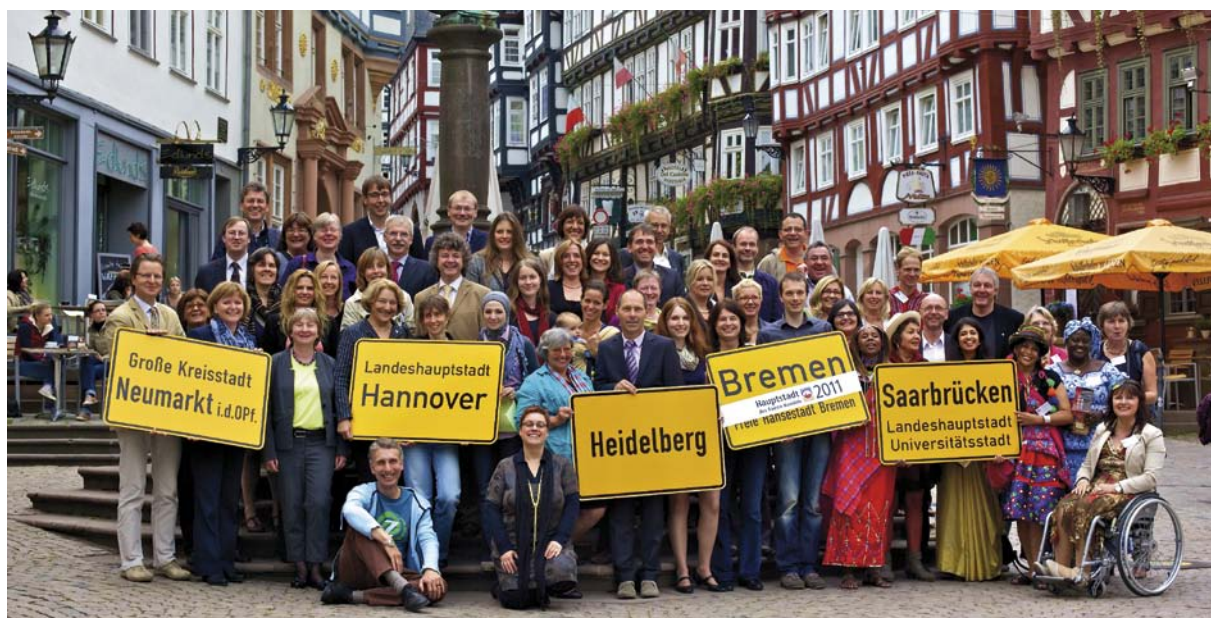
Preisträger des Wettbewerbes „Hauptstadt des Fairen Handels“ 2011 in der Altstadt von Marburg

Einer der Preisträger 2011 ist die im Bundesland Mecklenburg-Vorpommern liegende Gemeinde Bollewick. Sie hat ein funktionierendes Kooperationsnetzwerk gegründet, das den oft schwierigen Weg zum CO 2 -sparenden Bioenergiedorf ebnet. Seit 2009 haben sich bereits 68 Gemeinden und verschiedene Organisationen diesem Netzwerk angeschlossen. Da das Netzwerk weiterwächst, profitiert die gesamte Region, und der Umweltschutz wird aktiv gestärkt.