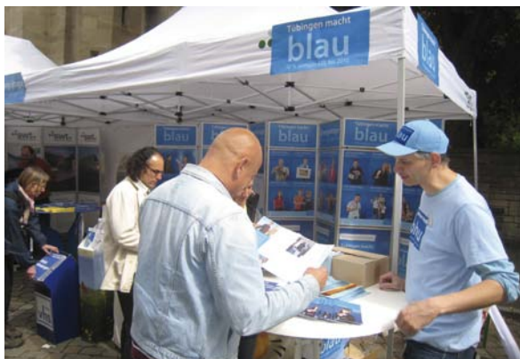
Informationsstand zur Energieberatung in Tübingen

Bei der vollständigen Umstellung der Energieerzeugung auf erneuerbare Energien sind häufig kleine Gemeinden in ländlichen Regionen wesentliche Impulsgeber. Sie verfügen zumeist über den Vorteil enger nachbarschaftlicher Kontakte, emotionaler Beziehungen zu ihrem Heimatort und können neue Ideen in direktem zwischenmenschlichen Kontakt besprechen. Das Erfahrungswissen dieser Innovatoren ist für die Energiewende unverzichtbar und sogar international gefragt.