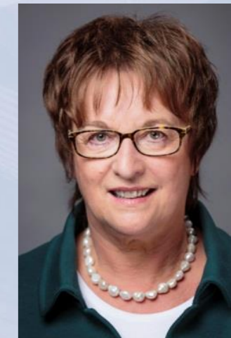
Brigitte Zypries Unterstützung des Ministers bei der Erfüllung seiner politischen und fachlichen Aufgaben, Koordinatorin der Bundesregierung für die Deutsche Luft- und Raumfahrt