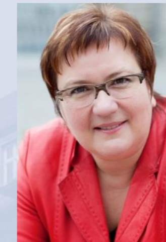
Iris Gleicke Unterstützung des Ministers bei der Erfüllung seiner politischen und fachlichen Aufgaben, Beauftragte der Bundesregierung für die neuen Bundesländer, für Mittelstand und Tourismus