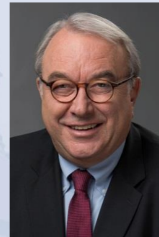
Uwe Beckmeyer Unterstützung des Ministers bei der Erfüllung seiner politischen und fachlichen Aufgaben, Koordinator der Bundesregierung für die Maritime Wirtschaft