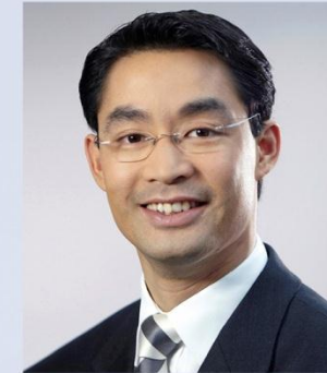
Dr. Philipp Rösler