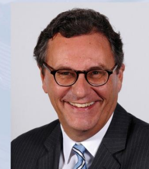
Hans-Joachim Otto Unterstützung des Ministers bei der Erfüllung seiner politischen und fachlichen Aufgaben, Koordinator der Bundesregierung für die maritime Wirtschaft