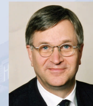
Peter Hintze Unterstützung des Ministers bei der Erfüllung seiner politischen und fachlichen Aufgaben, Koordinator der Bundesregierung für die Deutsche Luft- und Raumfahrt