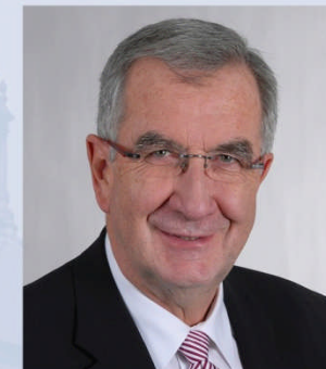
Ernst Burgbacher Unterstützung des Ministers bei der Erfüllung seiner politischen und fachlichen Aufgaben, Beauftragter der Bundesregierung für Mittelstand und Tourismus