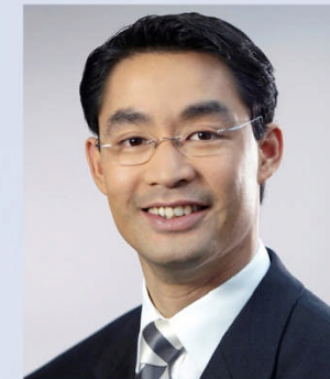
Dr. Philipp Rösler