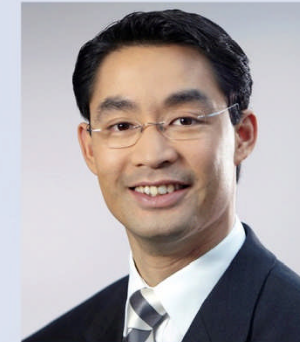
Dr. Philipp Rösler