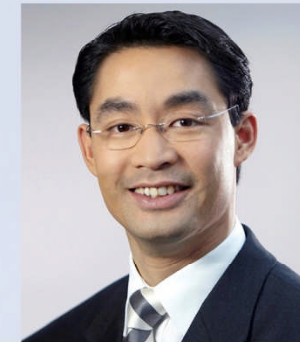
Dr. Philipp Rösler