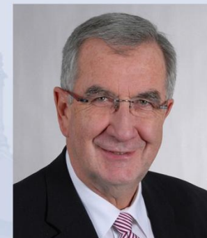
Ernst Burgbacher Unterstützung des Ministers bei der Erfüllung seiner politischen und fachlichen Aufgaben, Beauftragter der Bundesregierung für den Mittelstand und Tourismus