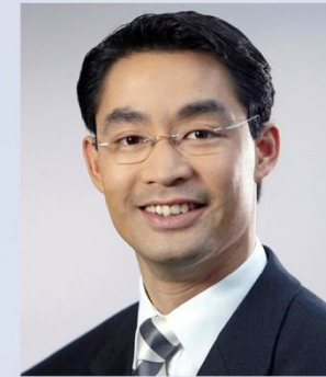
Dr. Philipp Rösler