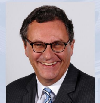
Hans-Joachim Otto Unterstützung des Ministers bei der Erfüllung seiner politischen und fachlichen Aufgaben, Koordinator der Bundesregierung für die maritime Wirtschaft