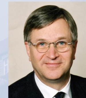
Peter Hintze Unterstützung des Ministers bei der Erfüllung seiner politischen und fachlichen Aufgaben, Koordinator der Bundesregierung für die Deutsche Luft- und Raumfahrt